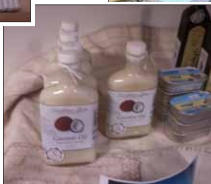
Diverse caribische produkten