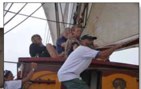
Crew en trainees aan het werk