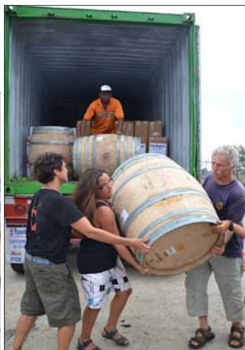
Deze vaten wijn gaan een rondje Atlantic meemaken