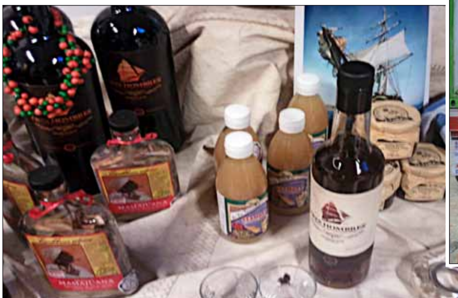
Tres Hombres rum, wijn en andere heerlijkheden