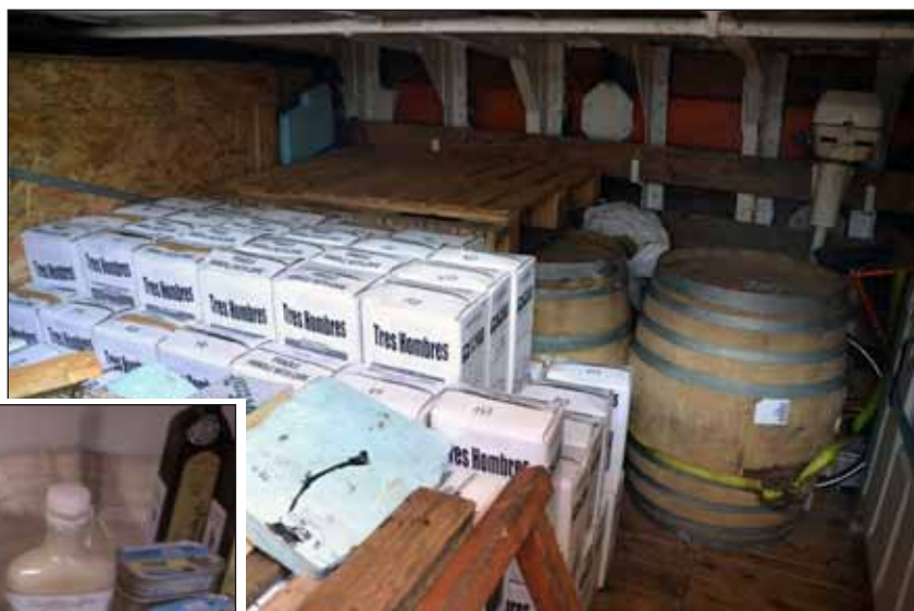
Vrachtruim met rum en vaten wijn