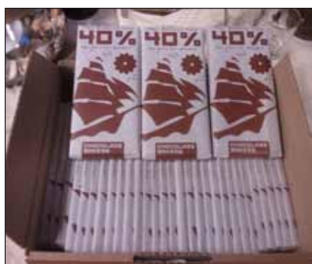
Tres Hombres chocolade met zeezout

Lastiger is het om vracht mee te nemen van Nederland /Europa richting het caribisch gebied. Pas als dat ook volledig lukt spreek je over een rendabele exploitatie. We hebben wel al een paar opdrachten, zoals de inboedel voor een emigratie naar het caribisch gebied. Een bijzondere lading is het vervoer van twee vaten wijn vanuit Frankrijk. Deze lading gaat de hele reis mee omdat het rijpingsproces dan twee keer zo snel gaat als wanneer de vaten in een wijnkelder worden opgeslagen. Bovendien heeft de zilte lucht en de golfslag een positief effect op de smaak en de kwaliteit. Kortom ook de ontwikkelingen rond vracht vanuit Europa naar het caribisch gebied zijn hoopgevend.