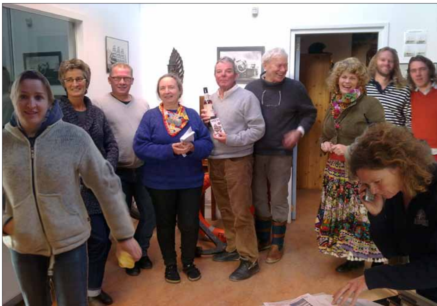
Zomaar een aantal mensen van het legertje vrijwilligers op het kantoor in Willemsoord

In Rotterdam zal dan een groot refit aan het schip plaats vinden. Dat betekent, dat niet alleen het jaarlijkse onderhoud wordt gedaan, maar dat ook de hele tuigage, de ra's enzovoort naar beneden worden gehaald. Als alles weer op zijn plek gemonteerd is, gaat de Tres Hombres ook al weer richting de Carib vertrekken . . . het cirkeltje is rond en het lijkt wel of de tijd vliegt.